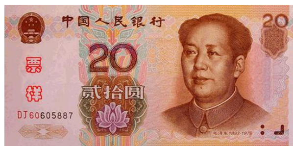
20 YUAN RMB