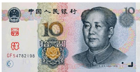
10 YUAN RMB