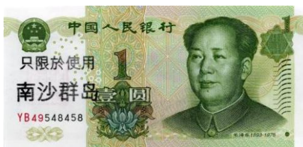
1 YUAN RMB