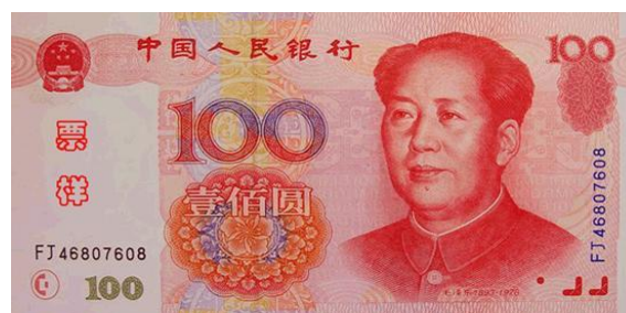
100 YUAN RMB