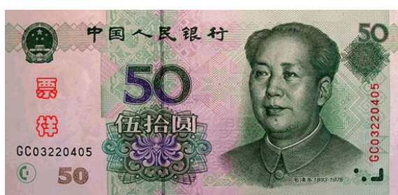
50 YUAN RMB