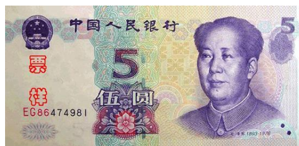
5 YUAN RMB