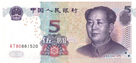
5 yuan Rmb