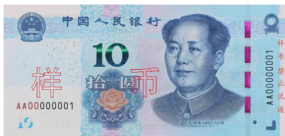
10 yuan Rmb