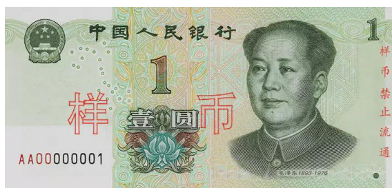
1 yuan Rmb