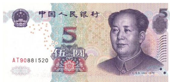
5 yuan Rmb