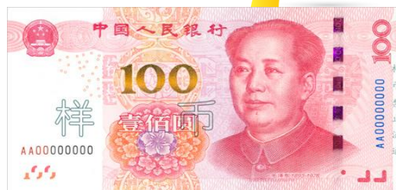
100 yuan Rmb