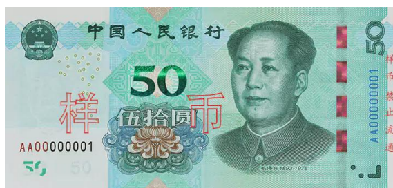
50 yuan Rmb