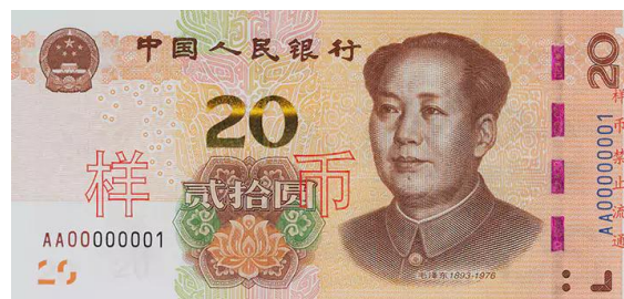
20 yuan Rmb