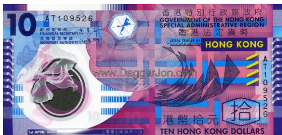
10 dólares Hong Kong