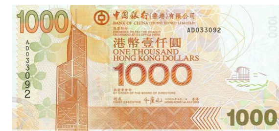
1,000 dólares Hong Kong