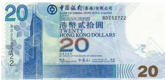
20 dólares Hong Kong