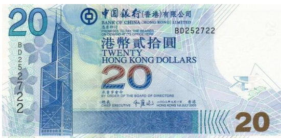
20 dólares Hong Kong