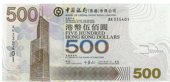
500 dólares Hong Kong