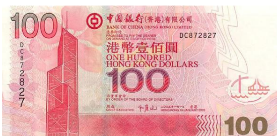
100 dólares Hong Kong