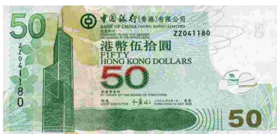
50 dólares Hong Kong