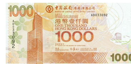
1,000 dólares Hong Kong