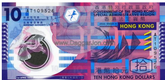
10 dólares Hong Kong